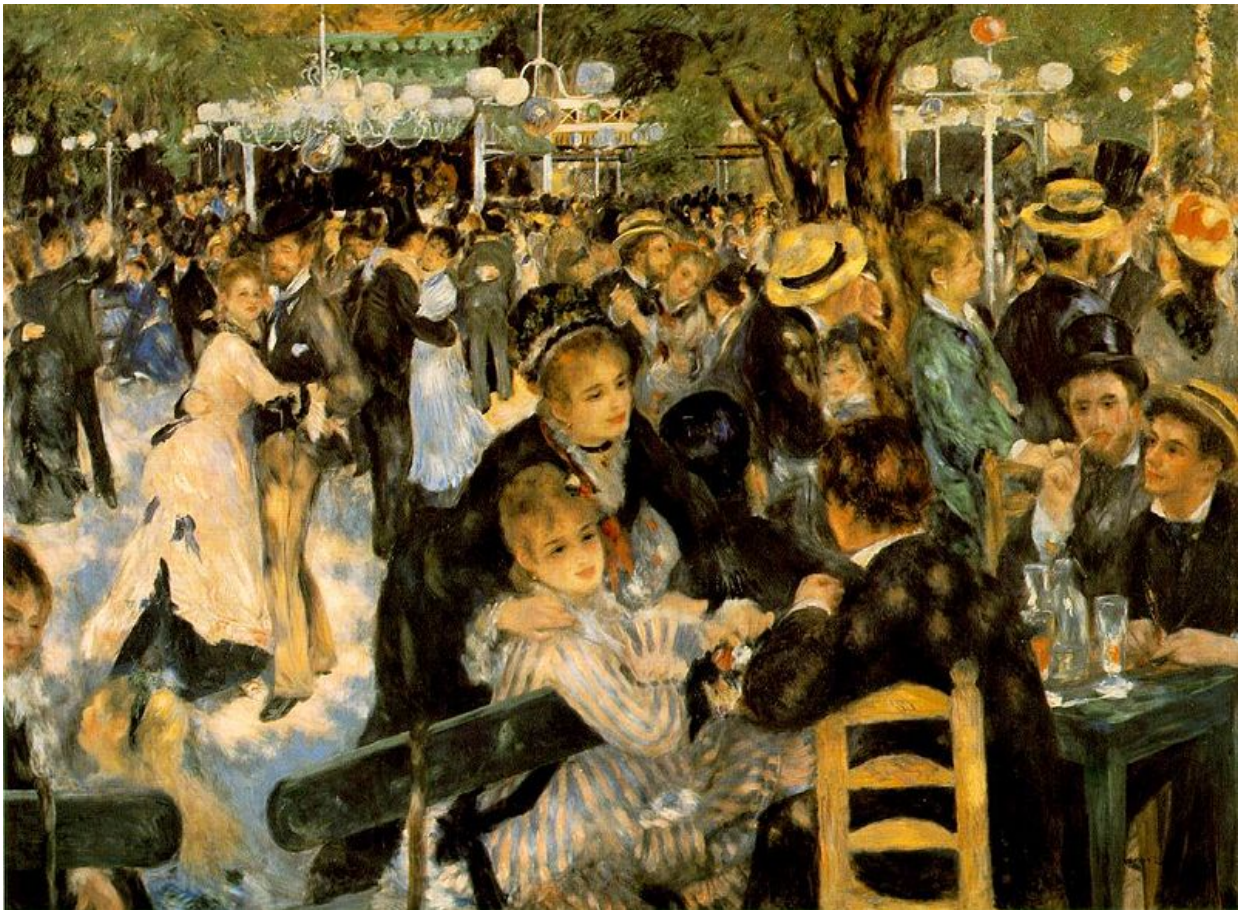
Pierre-Auguste Renoir: La Moulin de la Galette, 1876 - Musée d'Orsay

Lo scopo di queste esercitazioni è di fornire agli studenti un piccolo campione degli esercizi e delle domande che possono essere assegnati all'esame di Macroeconomia 2.